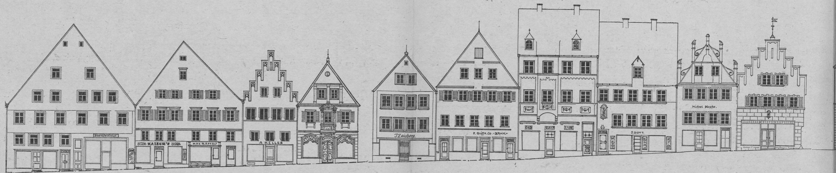
Bestandzeichnung der südlichen Stra